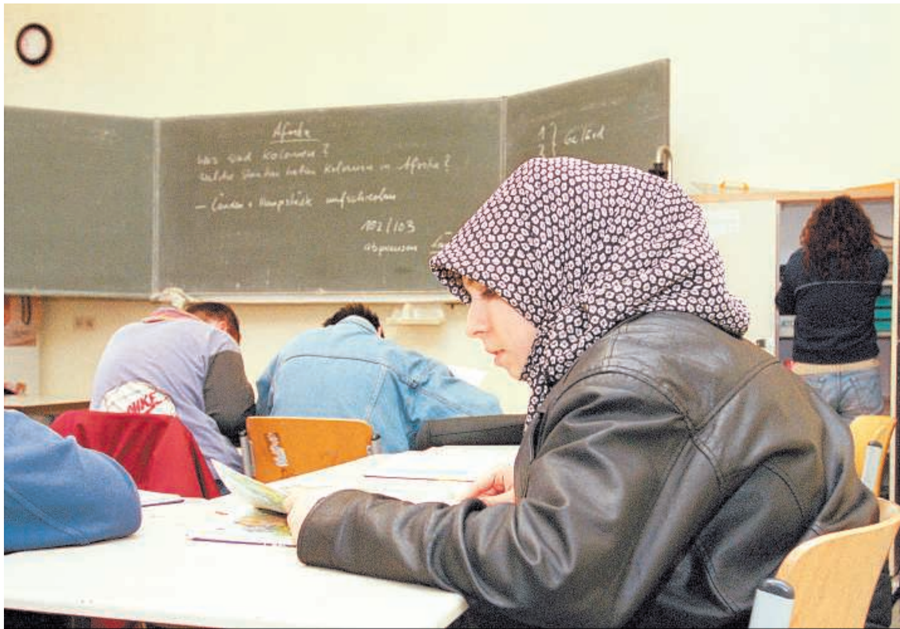
An der Werner-Stephan-Oberschule in Berlin-Tempelhof ist vieles anders: Eine Unterrichtsstunde zum Beispiel hat nur vierzig Minuten.

Soll die deutsche Bildungspolitik aufs „englische Pferd“ setzen? Besser nicht. Eine Anpassung unserer Schulen an staatliche Standards und verordnete Outputs ist keine Lösung. Standards wirken nur sinnvoll, wenn Schulen bei der pädagogischen Arbeit und Schulentwicklung unterstützt werden. Und wenn das Schulsystem die individuelle Schülerleistung und die soziale Chancengleichheit mehr würdigt.